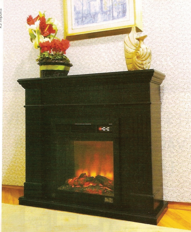
Lareira elétrica compacta e adaptada ao ambiente

são boas opções, principalmente para a região serrana, onde o frio é mais intenso.”